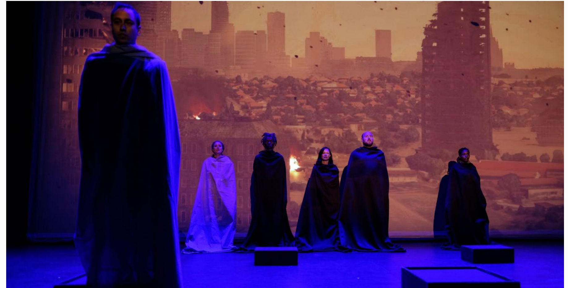
Quel dernier grand conflit pour satisfaire la haine entre les humains

Soyez concis, clair et direct. Évitez le ton marketing.