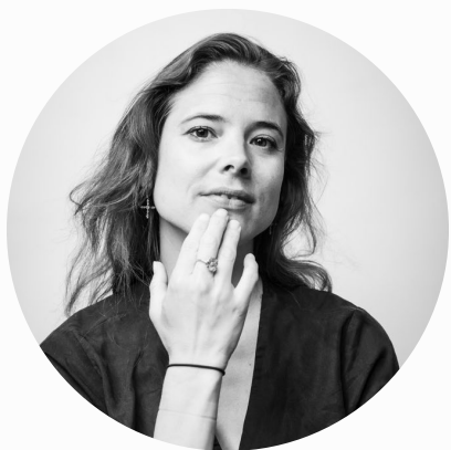
Laure Roldàn Grand-Duché de Luxembourg