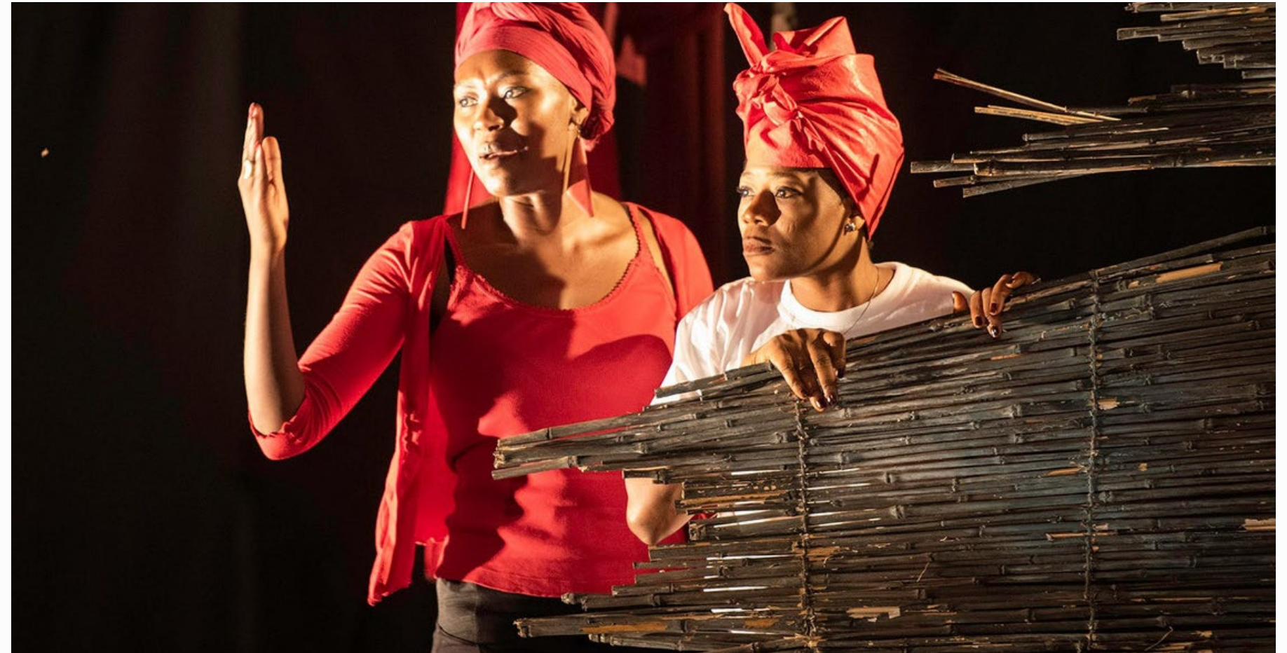
Plaidoirie pour vendre le Congo

Soyez concis, clair et direct. Évitez le ton marketing.