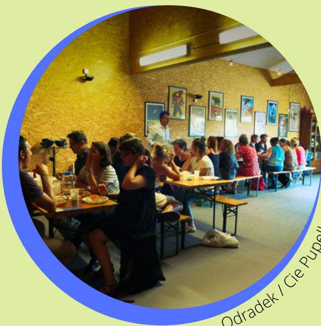
Odradek / Cie Pupella Nogues