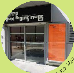
Le Théâtre aux Mains Nues