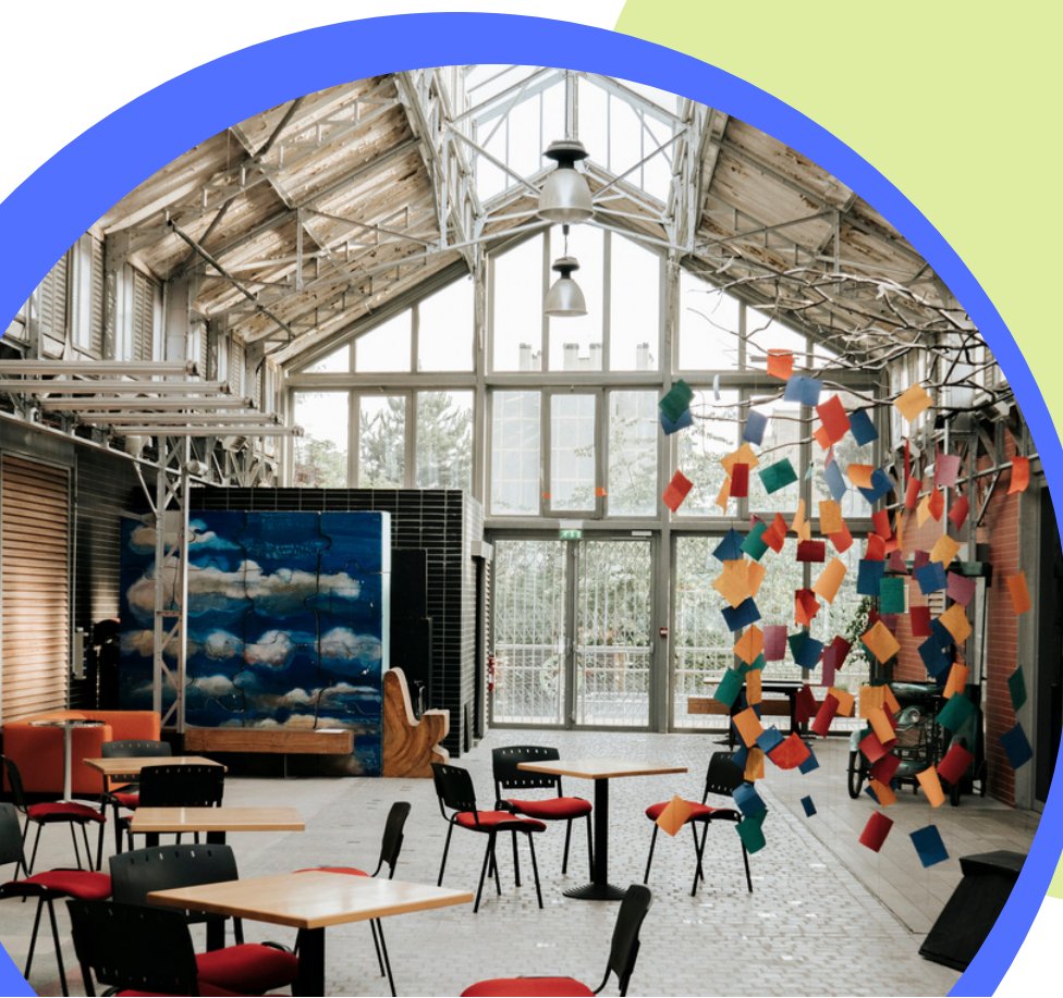
Théâtre Halle Roublot

● Transmission artistique : Une attention particulière est portée à l'accueil de jeunes artistes ou équipes artistiques ayant finalisé leur formation initiale, dans une démarche de soutien à leur insertion professionnelle. Mais le compagnonnage peut s'adresser à tout artiste qui en exprime le besoin dans le cadre d'une évolution de son parcours. Dans tous les cas, le compagnonnage a pour objectif la transmission d'un art, d'une histoire d'une compagnie/d'un lieu et du métier de marionnettiste.