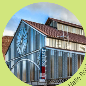
Théâtre Halle Roublot