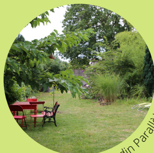
Le Jardin Parallèle