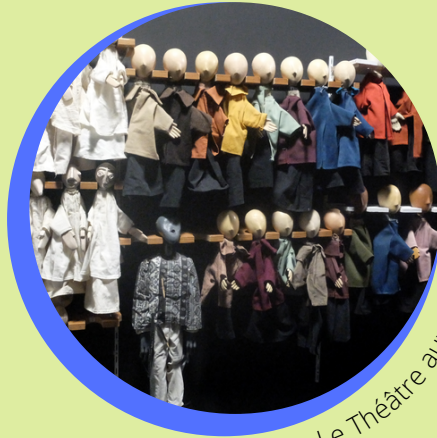
Le Théâtre aux Mains Nues