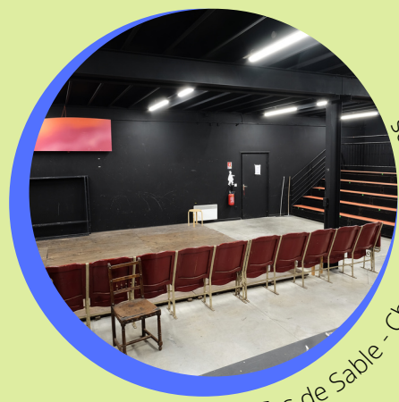
Le Tas de Sable - Ches Panses Vertes