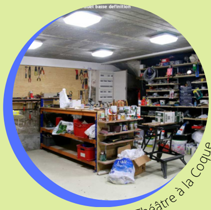
Le Théâtre à la Coque