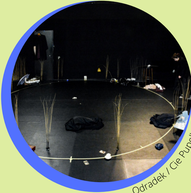
Odradek / Cie Pupella Nogues