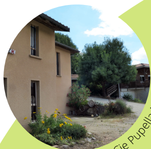
Odradek / Cie Pupella Nogues