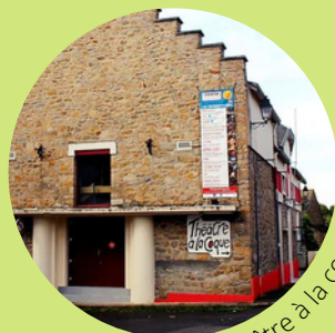
Le Théâtre à la Coque