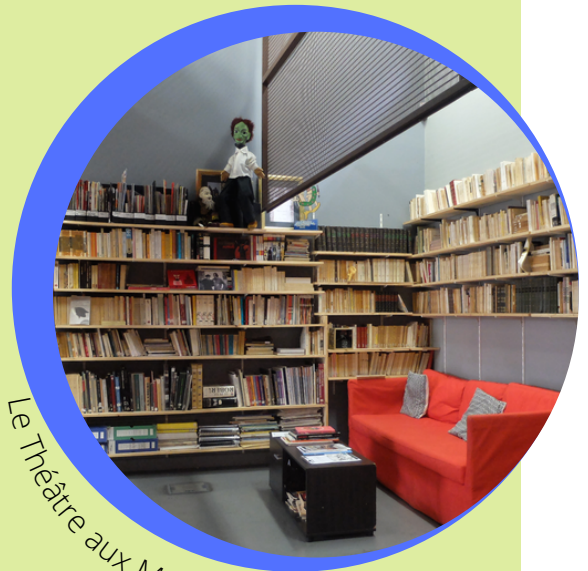
Le Théâtre aux Mains Nues