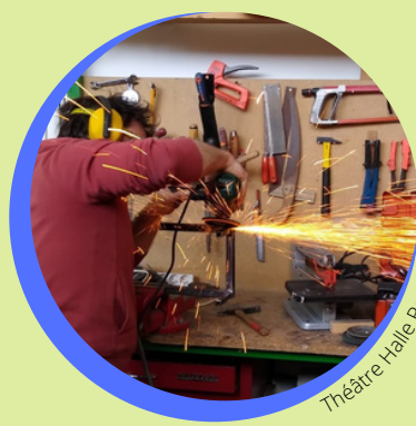
Théâtre Halle Roublot