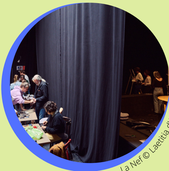
La Nef