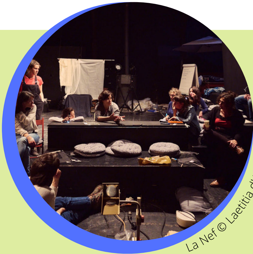
La Nef