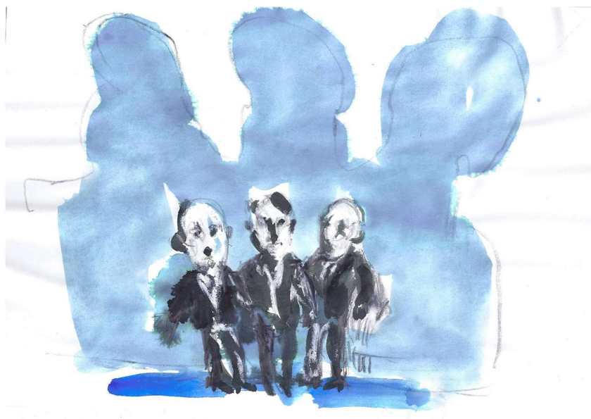
Dessins de Jean-Benoit L'héritier

Mademoiselle Redepennig prend les sacs aux hommes politiques et sort en les emportant