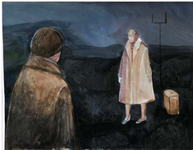
La Femme qui attend le bus

Qui sont ces créatures, fragiles marionnettes dont les figures nous questionnent sur nos propres vies ? De quoi vivent-elles ? Quelles sont leurs motivations ? Qui sont les « drôles de gens » qui peuplent Le Petit Théâtre du Bout du Monde ? La force de ces personnages est aussi en partie le fruit de leur bizarrerie, de leur étrangeté, donc de leur mystère. Chaque personnage confronté au lieu, fabrique devant nous un moment de présent , constitutif de sa condition. Inquiétante étrangeté d'un monde de l'Ailleurs, « drôles de gens ». Ils font aussi ce que nous faisons tous les jours : attendre longtemps un bus, dormir, regarder la télé, mettre de l'huile dans une machine. Leur temps ne passe pas. Ou bien, ils passent leur temps à attendre que ce temps passe, pour sortir de cet état. Ça nous ressemble tout de même, et de manière troublante. Ainsi sont nés : la Vieille à la porte, la Jeune Femme à l'arrêt d'autobus, le Singe-Taube aux yeux lumineux, l'Administrateur, le Petit Appariteur, Le Banquier, l'Homme-sandwich, L'Homme-qui-regarde-la-télévision. Dans ce Work in Progress , d'autres êtres sont en gestation... comme, le Gardien-du-terrain-vague et son double, le Boutiquier, le Transporteur-d'obus, le Porteur-de-ballots... Ils sont dans une posture qui pose la même question : À QUOI PENSENT-ILS? Peuvent-ils penser en dehors de leur contrainte ? Nous avons décidé de ne pas y répondre dans l'immédiat.