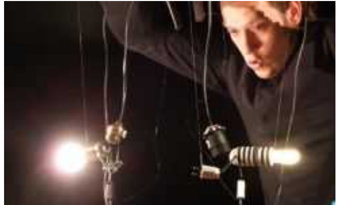
C'est la guerre des lumières entre Monsieur Watt et la lampe à économie d'énergie.

Lire calmement avant de se coucher, lové sur son oreiller-porte-lunettes et dans sa couette-mouchoir. Vibrer de tout son filament lors de la finale de la coupe du monde de foot. Mais voilà que le vieil homme ramène une autre ampoule, une lampe économique. Une perturbatrice dans son monde si parfait. La guerre est déclarée, les éclairs de lumière font rage. Avant de claquer toutes les deux... et de faire rire aux éclats la bonne vieille bougie. Mêlant mime, marionnette et masque, cette petite forme de spectacle est un rayon de soleil pour tous les âges. Une fable poétique sur ce que l'innovation ne pourra jamais remplacer.