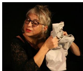
Papier froissé, déchiré, plié,