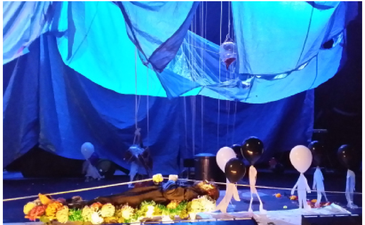
PHOTO RÉPÉTITION AOUT 2017