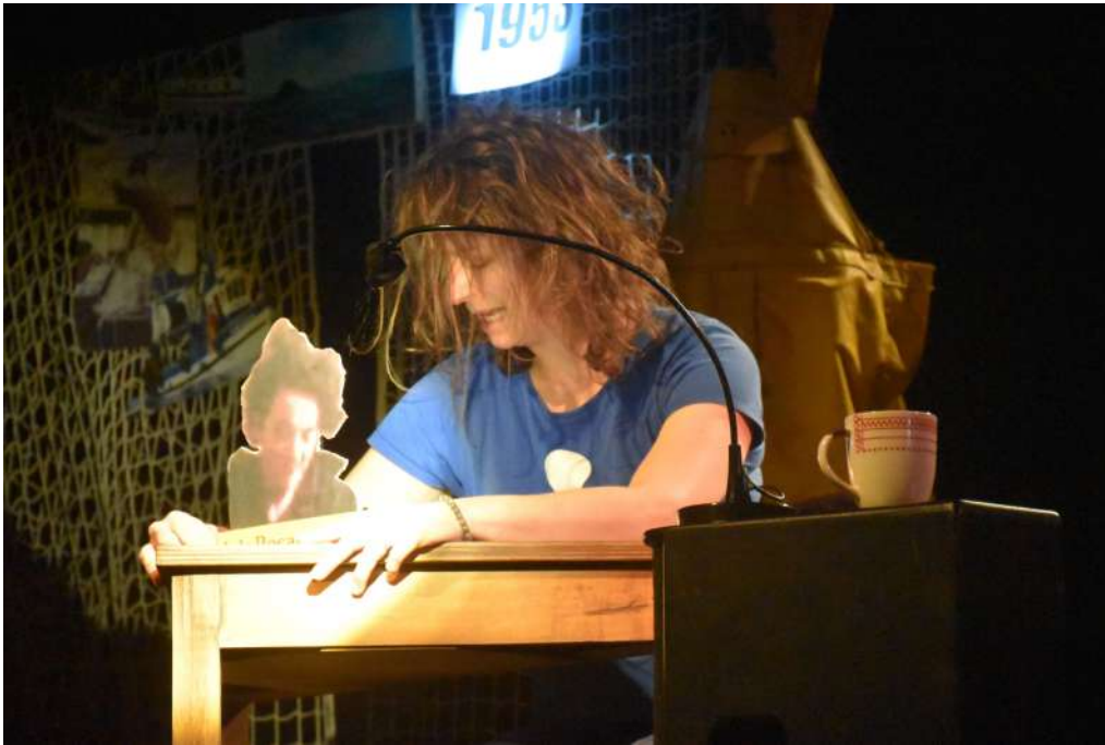
Photo de sortie de résidence au Théâtre Arletty à Belle-Ile-en-mer