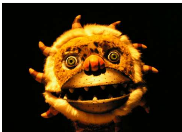
Marionnette « Jabberwocky »

L'idée aussi de l'interdépendance m'intéresse, le fait que sans la marionnette, le marionnettiste n'est pas grand chose et vice versa : ils ont besoin l'un de l'autre, il faut qu'ils prennent soin l'un de l'autre.