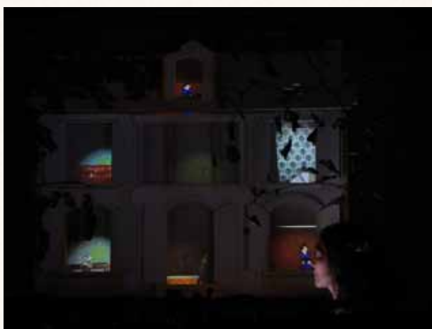
L'Empire des Lumières de René Magritte, « Mon enfance » à l'Échalier, St-Agil (41), juin 2022 Inspiration pour « Mon enfance »