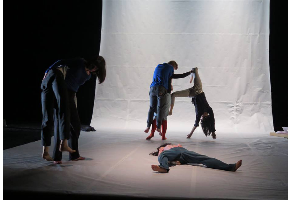
Images de répétition de la dernière partie du spectacle

Plus d'infos : www.brigittenielsensociety.fr