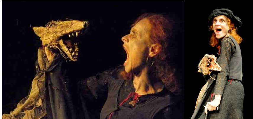
Sinon je te mange