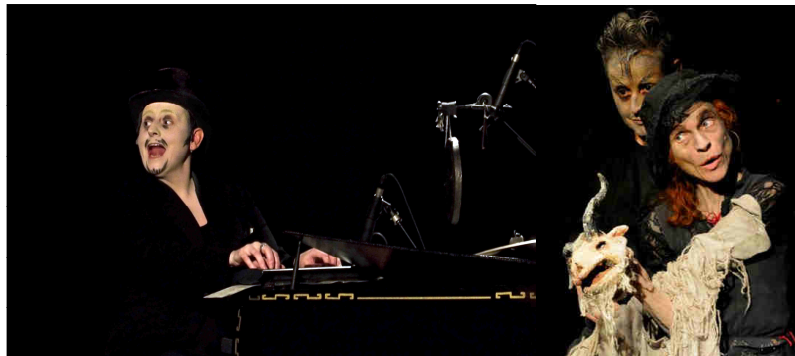
La vieille et la bête/Sinon Je te mange - Crédit photo Nicolas Piton/Marinette Delanné

Mon aventure artistique avec Ilka a commencé avec La vieille et la bête il y a six ans, bientôt suivi par Sinon, je te mange . Six années pendant lesquelles nous avons partagé la scène, les repas, les routes, les tournées. Six années de découvertes et d'enrichissement artistiques à ses côtés.