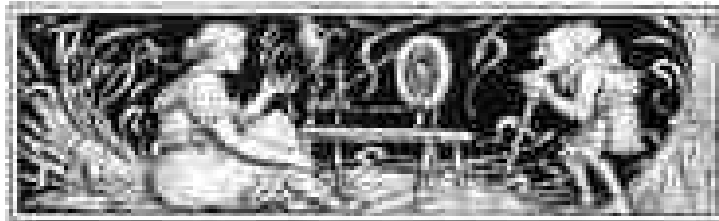
Walter Crane, 1882