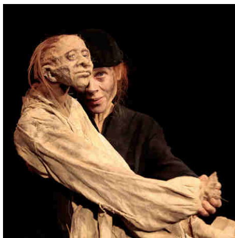
La vieille et la bête Marionnette d’Ilka Schönbein 2014 - Mario del Curto

"Eh bien, dansez maintenant" dit la fourmi à la cigale, qui dans sa détresse la supplie de lui donner une miette de pain .