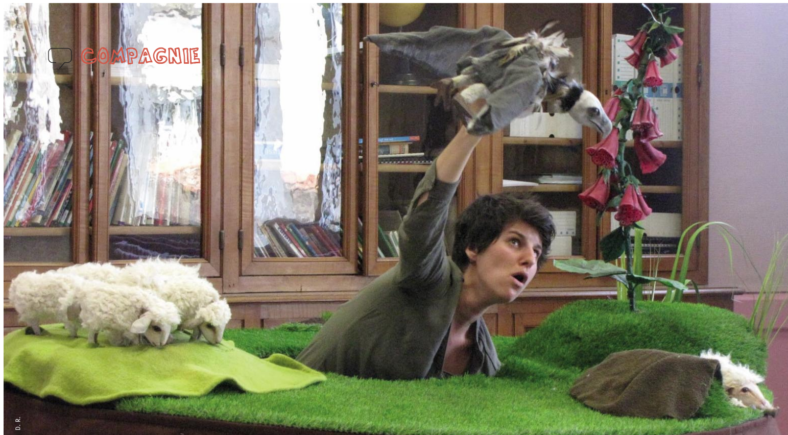
L'Agneau a menti, compagnie Arnica