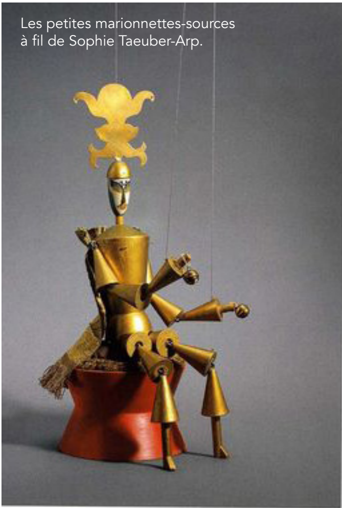
Les petites marionnettes-sources à fil de Sophie Taeuber-Arp.