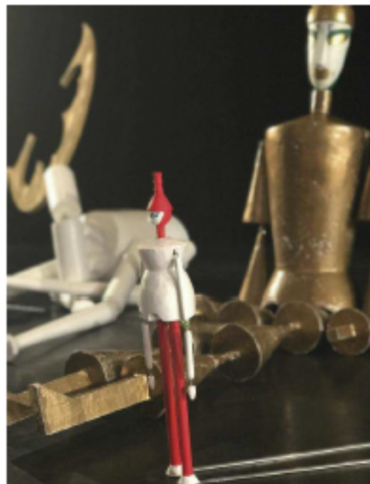
Dadaaa sera créé en mars prochain au TP