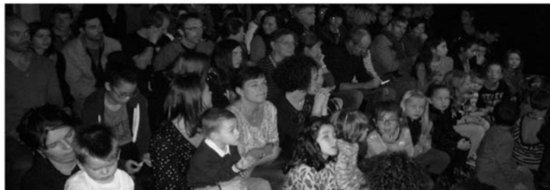
□ Un public conquis.

çus en fin de spectacle par les comédiens sont indéniablement mérités. Ils sont l'aboutissement d'un travail de plusieurs mois nécessaires pour mener à terme cette nouvelle aventure.