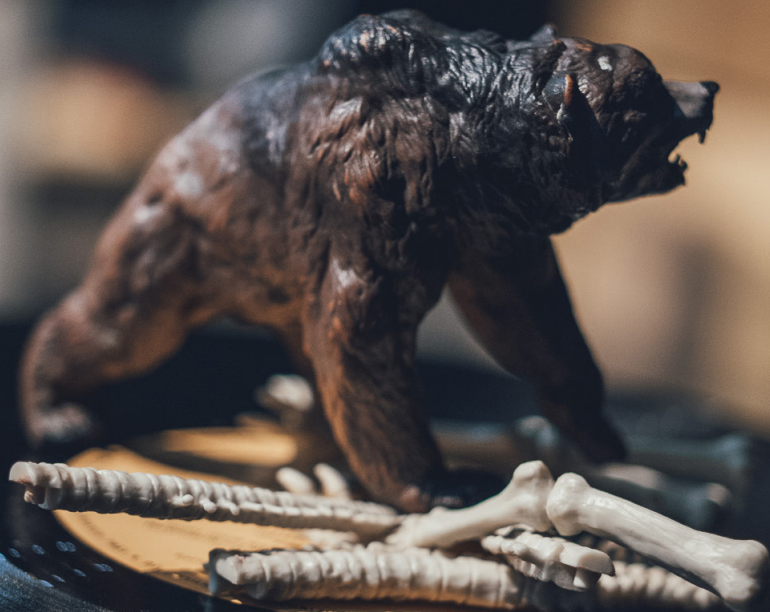
NOS FANTÔMES - photo de répétition © E.Massua