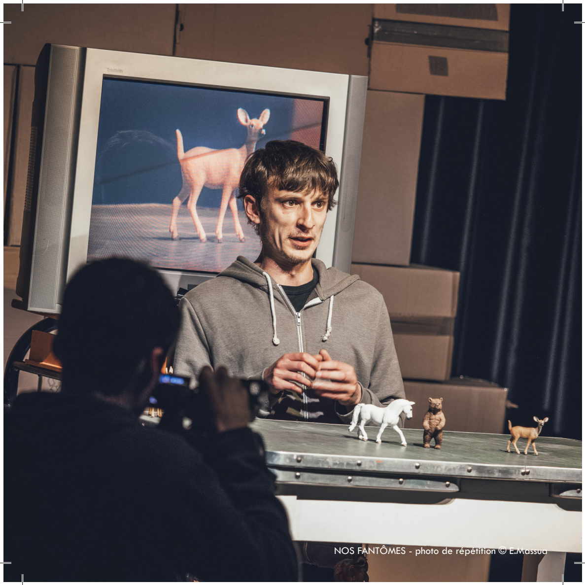
NOS FANTÔMES - photo de répétition