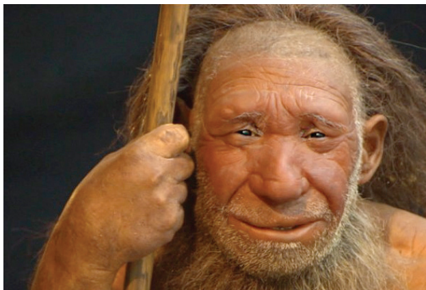
RECONSTITUTION D'UN HOMME DE NEANDERTAL AU MUSÉE NEANDERTAL EN ALLEMAGNE

A partir de cet ancêtre commun et à un moment précis, les deux espèces ont divergé.