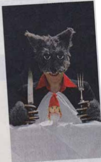
Rouge Jusqu'au 8 mars, Lucernaire.

Après avoir tenté de raconter plusieurs histoires (les trois petits cochons en guimauve se font manger illico par le loup, le Petit Poucet n'a même pas le temps de frémir de peur...), la conteuse-marionnettiste et son acolyte musicien-loup entament le conte de Rouge . La trame est celle bien connue du Petit Chaperon rouge , mais adaptée à leur façon: entre chansons originales et comptines traditionnelles (accordéons, vielle, flûte chinoise), inventions scénographiques et trouvailles de marionnettiste. Une belle esthétique pour ce spectacle plein de talent, d'allant et de créativité.