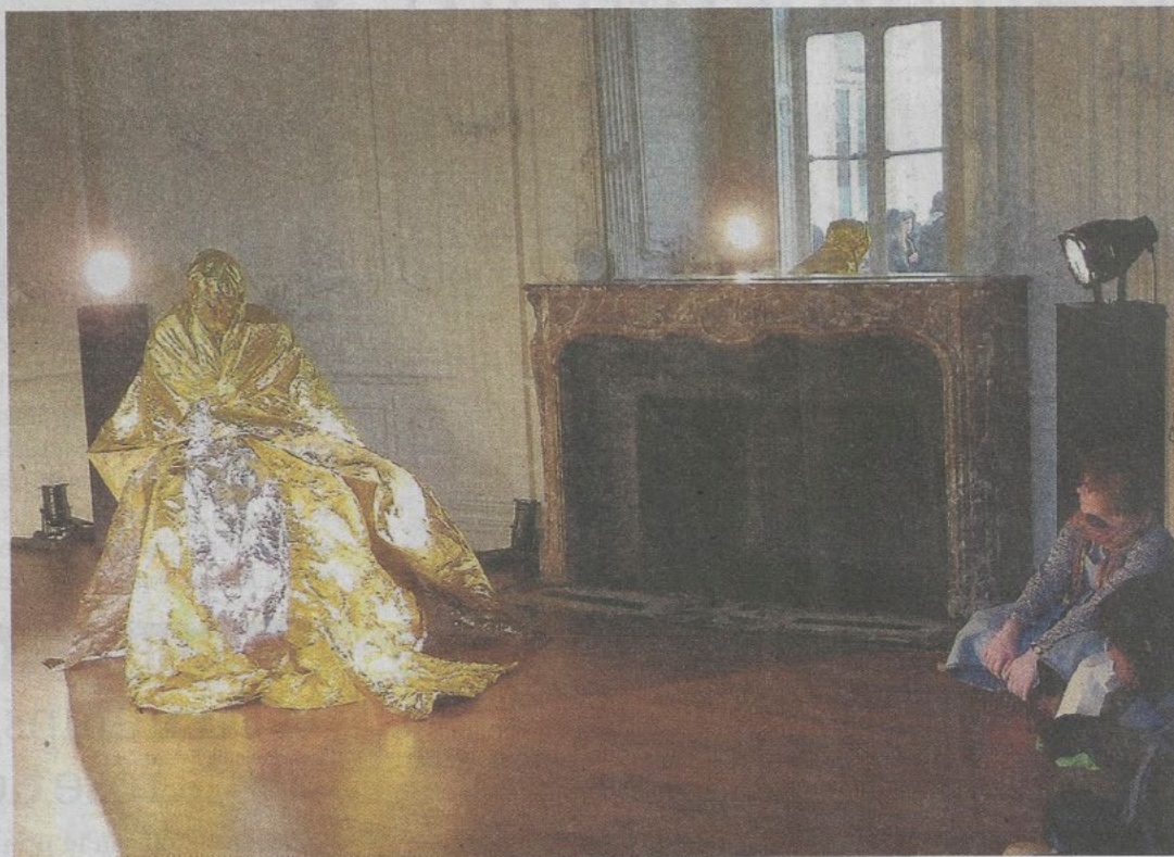
Une vue lors de l'interprétation de la pièce Die Verwandlung.