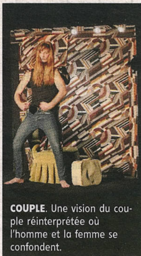
COUPLE. Une vision du couple réinterprétée où l'homme et la femme se confondent.

Sur scène, un homme et une femme qui interrogent le spectateur sur l'identité du couple, et qui permet au public de rentrer dans l'intimité de leur