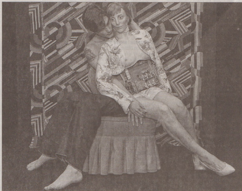
■ De l'homme, de la femme et de l'objet, difficile parfois de faire la part des choses.

Bouche cousue néanmoins sur ce spectacle, « L'un dans l'autre », histoire en images d'un couple... tout ce qu'il y a de plus banal. Si banal