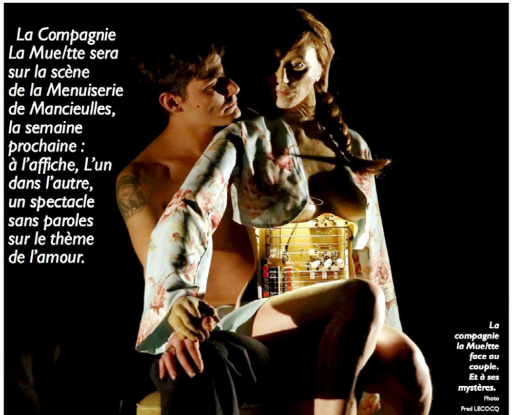
La compagnie la Mue/tte face au couple. Et à ses mystères.

La Compagnie La Mue/tte sera sur la scène de la Menuiserie de Mancieulles, la semaine prochaine : à l'affiche, L'un dans l'autre, un spectacle sans paroles sur le thème de l'amour.