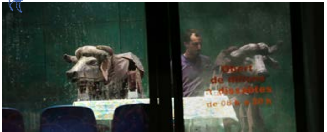
Buffles - générale au Théâtre de Bourg-en-Bresse, janvier 19