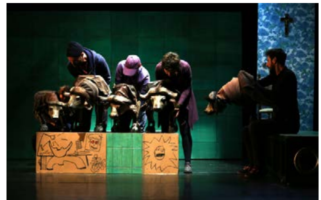
Buffles - janvier 19 - générale au Théâtre de Bourg-en-Bresse