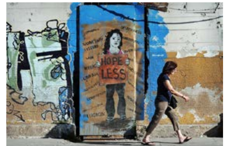
«Hopeless» : Street art contestataire à Athènes